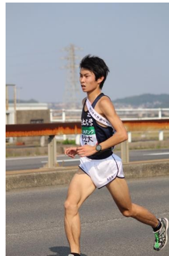
▲安定した走りの出口

今年は6月に5000mの人生ワーストタイムを2回も更新することから始まったシーズンでした。一時は全日で走ること自体が目標になっていた時もありましたが後輩の突き上げもあり、なんとか9月の予選会では15kmの部で走れるまで体を戻すことができました。全日の本戦では調子が上がらない中ではありましたが3番目に長い区間である4区を任せていただき、最終学年として悔いの残らない走りをしてチームに貢献したいと考えていました。しかしレースは中間点前には息が切れて余裕のない走りになり、一緒に繰り上げスタートした他の3校にも離されるといふ苦しい展開になってしまいました。結果は区間最下位で目標としていた設定タイムにも届きませんでした。前半から苦しい展開のなか大崩れすることは避けられたため最低限の仕事は果たせたかなと思います。